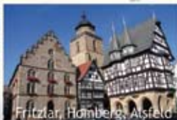
Fritzlar, Homberg, Alsfeld