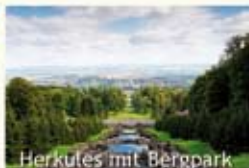
Herkules mit Bergpark