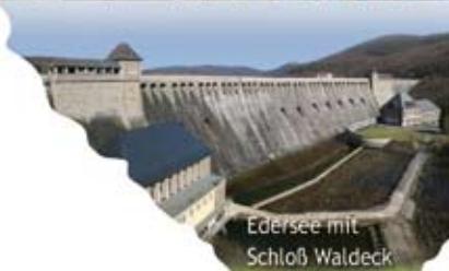
Edersee mit Schloß Waldeck

Schlösser Fachwerkstädte Kassel und Marburg Museen Nationalpark und Edersee Herkules mit Bergpark Tierparks Freizeitparks Tanz, Kino Theater Einkaufs- centren